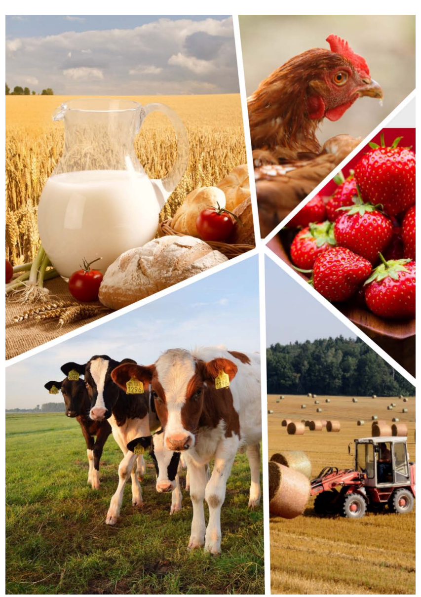
КАК СТАТЬ НАЧИНАЮЩИМ ФЕРМЕРОМ